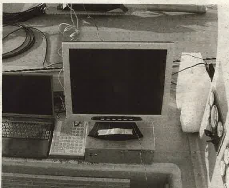
En la imagen, sonar de barrido lateral, una de sus herramientas.

Así, las consecuencias biológicas para la vida en el río son irreparables pero los efectos también modificarán de manera negativa la evolución de las playas de Huelva, influyendo sobre todo en las que están más cerca del río. Tanto es así que la arena de la costa dejará "lentamente" de regenerarse de manera natural y la marea erosionará las playas. Así, las regeneraciones artificiales de arena en la costa tendrán que ser más frecuentes, con el consiguiente aumento del coste económico para realizar estas acciones. Por cercanía, Isla Canela será la prime-