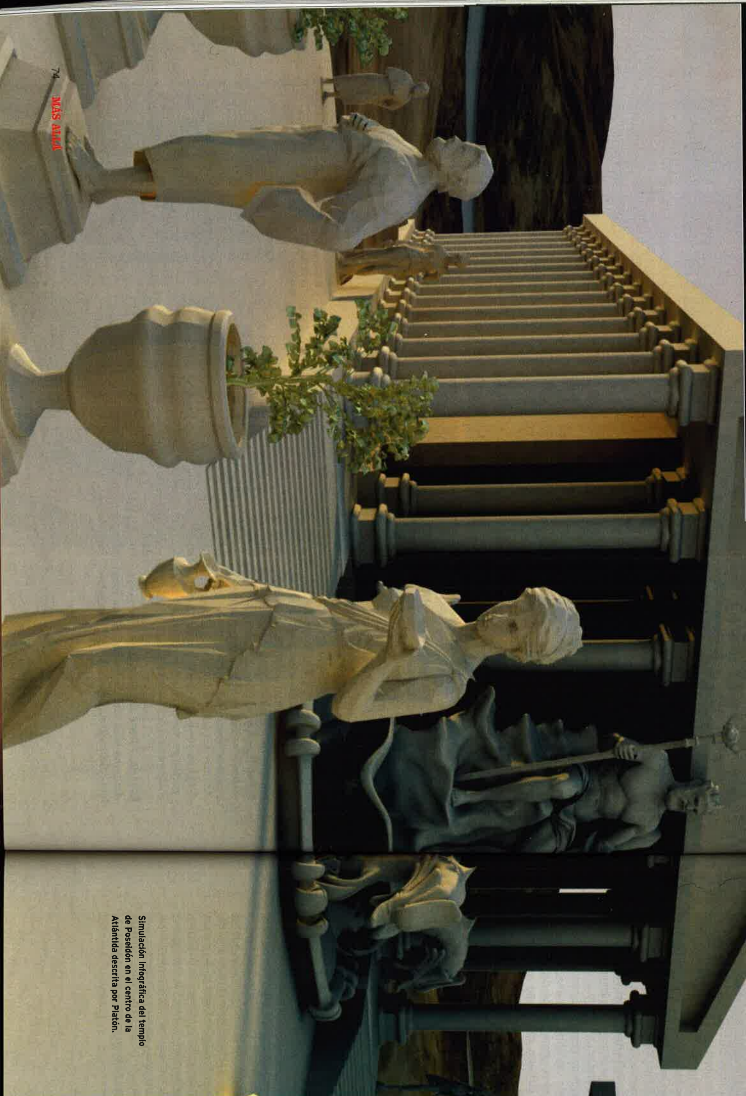
Simulación fotográfica del templo de Poseidón en el centro de la Atlántida descrita por Platón.