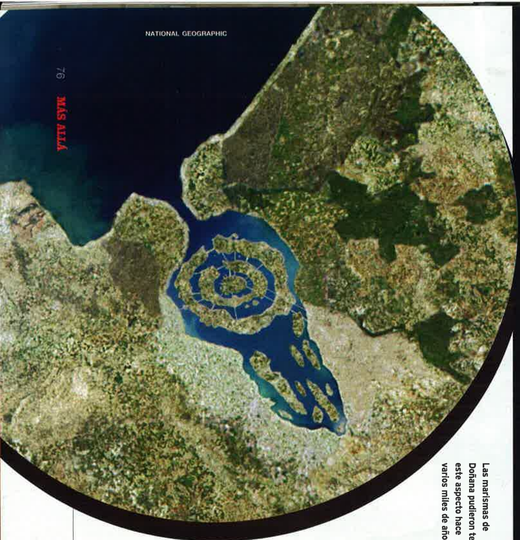
Las marismas de Doñana pudieron tener este aspecto hace varios miles de años.

MÁS ALLÁ ha tenido la oportunidad de reunirlos con ellos y entrevistarlos en exclusiva, para