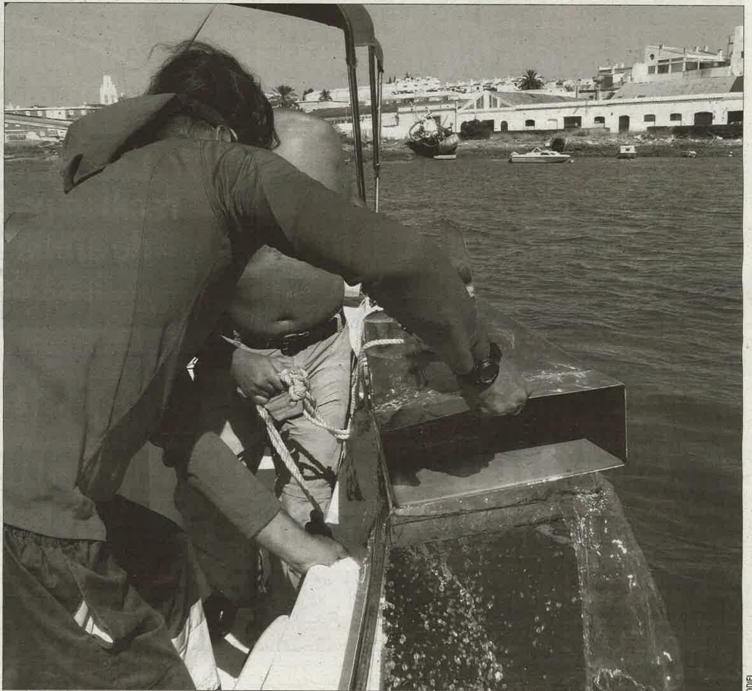
TÉCNICAS. Las trampas de sedimento se utilizan para analizar cuánta cantidad de arena transporta en río Guadiana.

Para llegar a estas conclusiones, el profesor de la UHU indica que primero tuvieron que estudiar el tránsito de arena por el estuario. "Este tránsito se ha cortado. Las corrientes ya no llevan